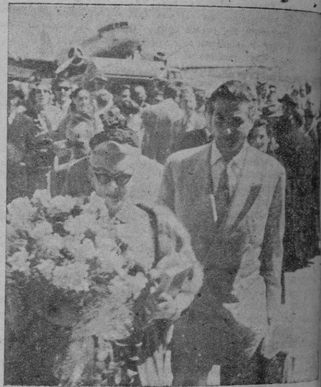
La bella artista norteamericana acompañada del actor de la pantalla Lex Baxter a su llegada a Son Bonet

Poca gente, a recibir a la famosa estrella cinematográfica. Tendrían la culpa, acaso, las pesetillas que le cobran a uno para el acceso al bello edificio de Mal'orca para descansar y a posible pasar desapercibida. —Hoy no quiero decirles nada. Mañana, tal vez, u otro día, dré recibirles.