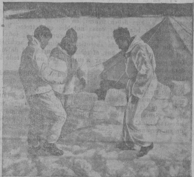
Un grupo de comandos de la Infantería de Marina británica, construye una muralla de nieve para resguardar su tienda del viento helado durante un entrenamiento celebrado en una región de nieves perpetuas.