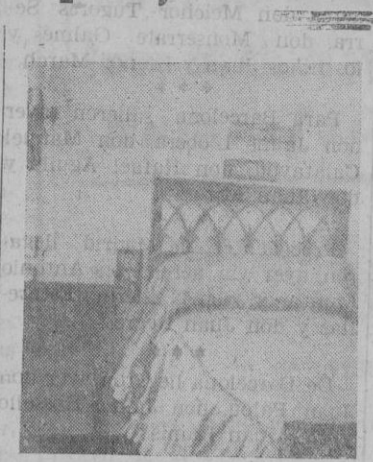
Aspecto parcial de uno de los camarotes de lujo y dos camas.

Efectivamente; volvemos a encontrarnos con el lujo confortable; amplios divanes tapizados también de material plástico y coquetas mesitas y sobre el suelo parquets plástico y alfombras; junto al recargado adorno de talla y ebanistería el sencillo de los sillones modernos, predominando en el salón el color rojo y verde, dándole un carácter de íntimo recogimiento.