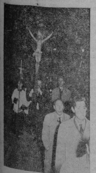
Un aspecto de la procesión del Via Crucis que organizan los Padres Capuchinos y que el dominó recorrió algunas calles del Ensanche