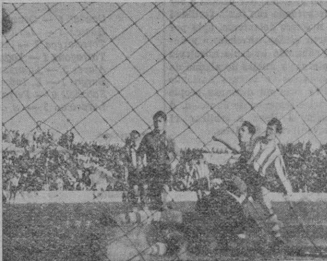
Uno de los goles obtenidos por el Mallorca