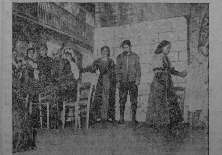
Los animosos estudiantes del T.E.U. representaron el domingo «En Flandes se ha puesto el sol». El grabado recoge uno de los momentos de la obra, largamente aplaudida por la concurrencia