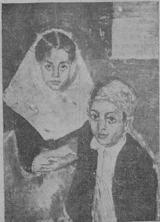
OILEO DE HANS LYSTLUND