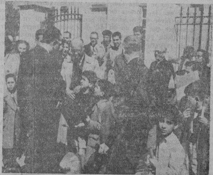
Durante su visita a la Escuela de Ciudad de Amispro conversa amablemente con los pequeños.