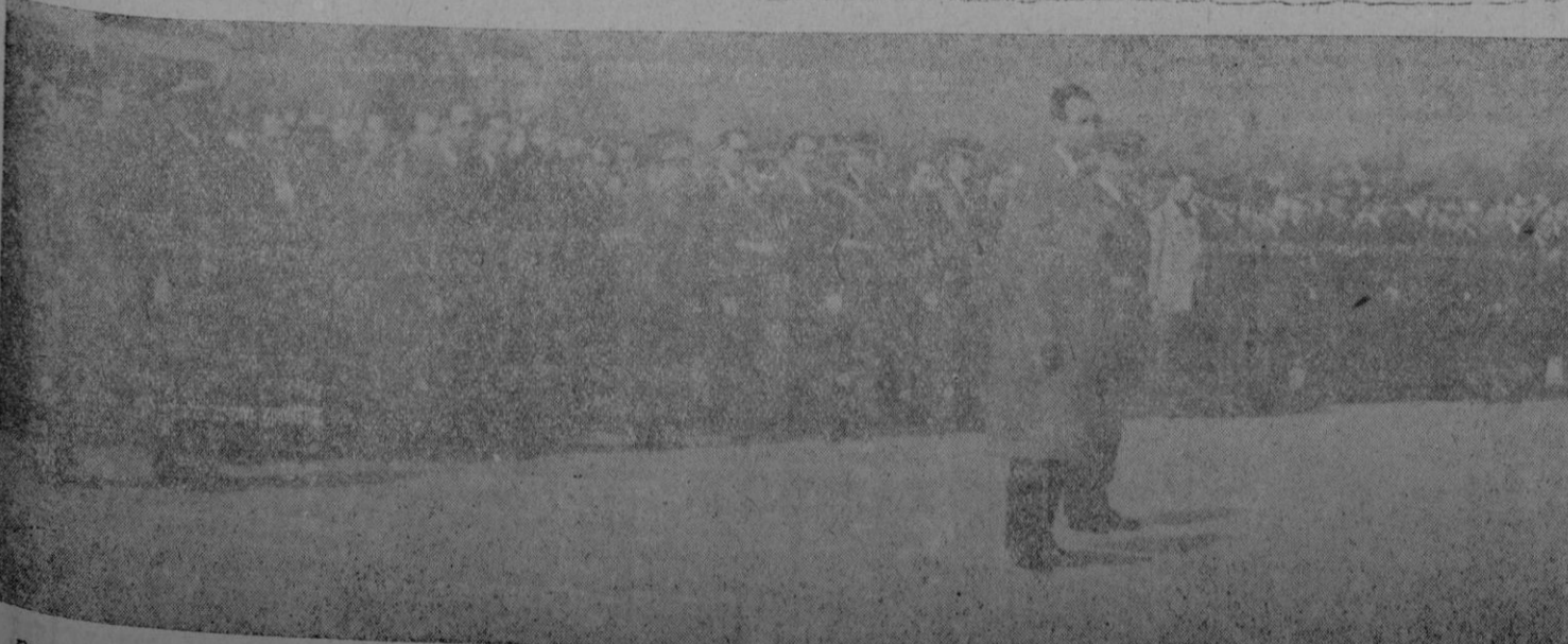
Esta instantánea recoge el momento en que el Excmo. Sr. D. Joaquín Ruiz Jiménez, Ministro de Educación Nacional, presencia, acompañado de las Autoridades y acompañantes, el desfile de las fuerzas de Aviación que le rindieron honores a su llegada al Aeropuerto de Son Bonet

Washington, 9.— James Dunn, nuevo Embajador de Estados Unidos en España visitó al Presidente Eisenhower para despedirse. Espera llegar a Madrid a últimos de mes.—Efe.