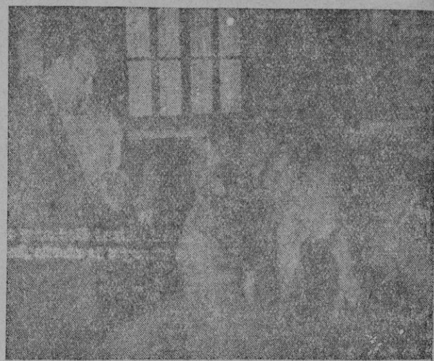
El Excmo. Sr. Ministro de Educación Nacional departiendo con los Catedráticos y Profesores de la Escuela de Comercio en su visita a aquel centro

Pues bien, dentro de este desconocimiento está el de estas islas mismas a las que aspiran siempre los novios para su viaje de felicidad y los extranjeros por su sol y como yo que voy descubriendo en esta visita su afán de cultura y de elevación espiritual. Para mí ya las Baleares, Mallorca hasta ahora, después Ibiza y Menorca, porque a todas ellas quiero conocer, tomarles el pulso y el latido, todas con belleza soberana aunque no las haya visto bajo el sol, que ello no me importa, pues yo no he venido como turista sino a palpar con vuestros propios anhelos, con el anhelo y la ilusión de vosotros, hombres enamorados de la tierra, sobre la cual os curvais con trabajo e ilusión.