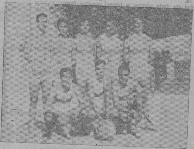
Equipo del Hispania, campeón

Garó el decisivo encuentro contra el "Nazaret"