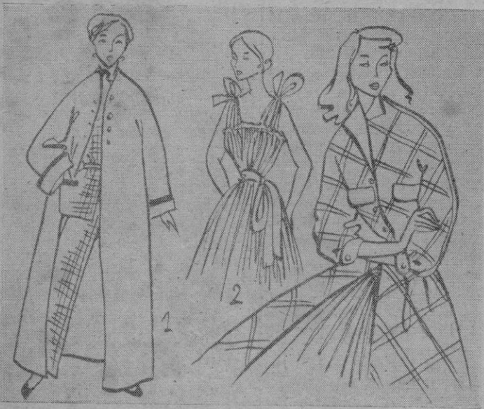
1 — Pijama en franela cuadrículada blanco y azul, con ribetes negros. Batin recto con manga japonesa, en terciopelo de lana roja.

—Las tocas, que se inclinan con gracia exquisita hacia la sien, bajo el peso de una