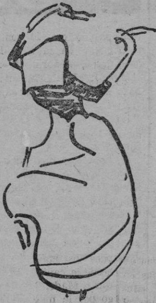
Dibujo, por Siri Meyer (Galerías Costa)

Su versión de los paisajes y sobre todo, de los tipos de Ibiza Siri Meyer están alegres y poseen