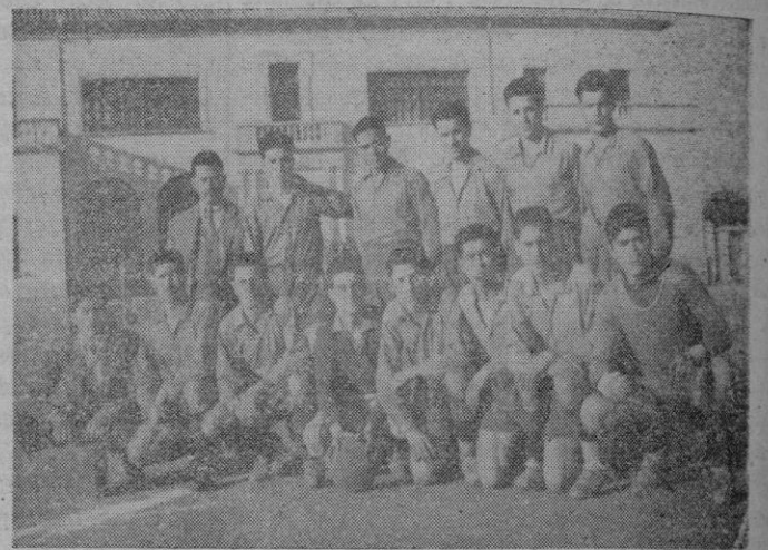
El equipo Murense que el pasado domingo alcanzó un valioso triunfo venciendo al potente once de Artá, que marcha en cabeza del grupo

Ayer tarde, en el campo de Son Canals, se enfrentaron en partido correspondiente al campeonato regional, los equipos Hostalets y Recreativo Mallorca. Tras una lucha muy reñida y en exceso dura, vencieron los hostalets por 4-2.