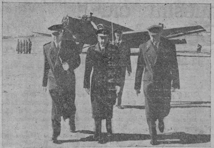
El general jefe de la Zona Aérea de Baleares a su llegada a Son San Juan