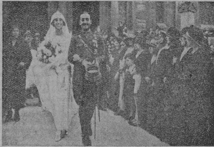
Después de la ceremonia nupcial los novios —el entonces teniente coronel Franco y doña Carmen Polo— salen del templo