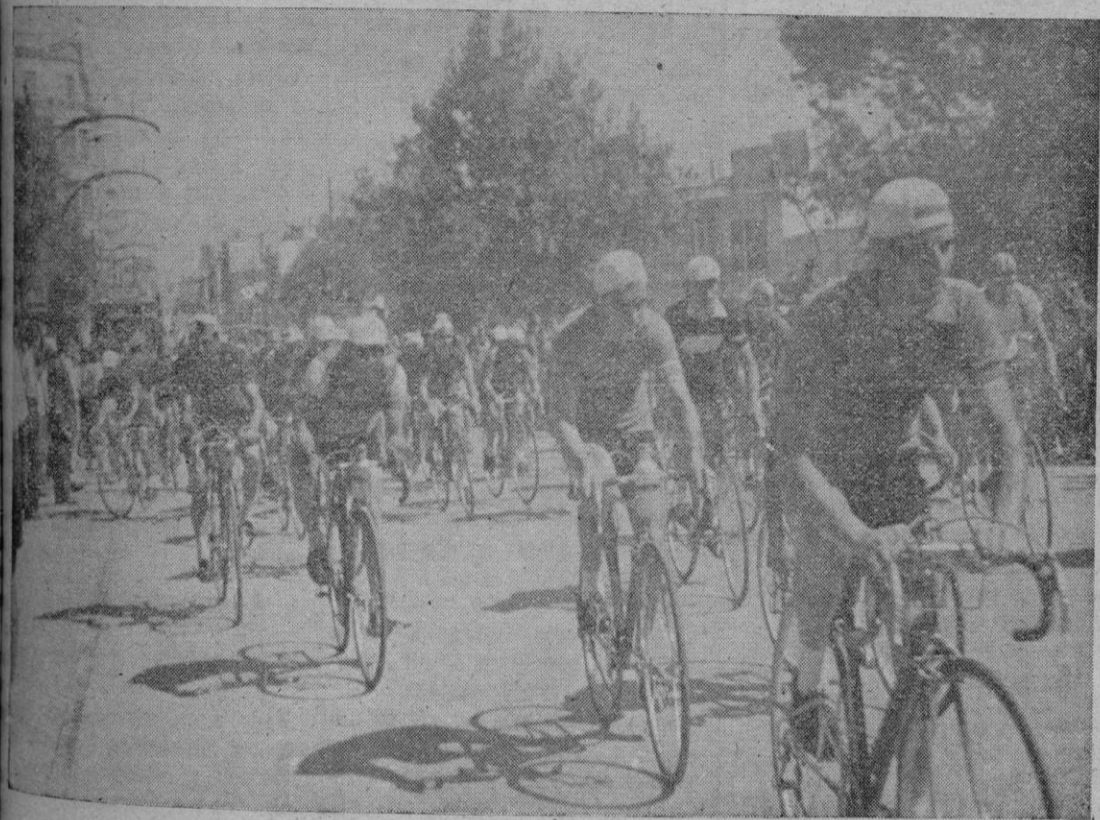
Los participantes en la Vuelta Ciclista a Mallorca en el momento de iniciar la gran ronda en la Plaza Progreso donde se había congregado un numeroso público que despidió a los corredores con cariñosos aplausos

La serpiente multicolor se alarga sobre el asfaltado camino de Andraitx. A la vanguardia, el pelotón en el que ya figuran varios mallorquines, lleva ahora ventaja sobre el grueso de la caravana. Lean en última página las incidencias de la vuelta recibidas de Manacor final de la primera etapa