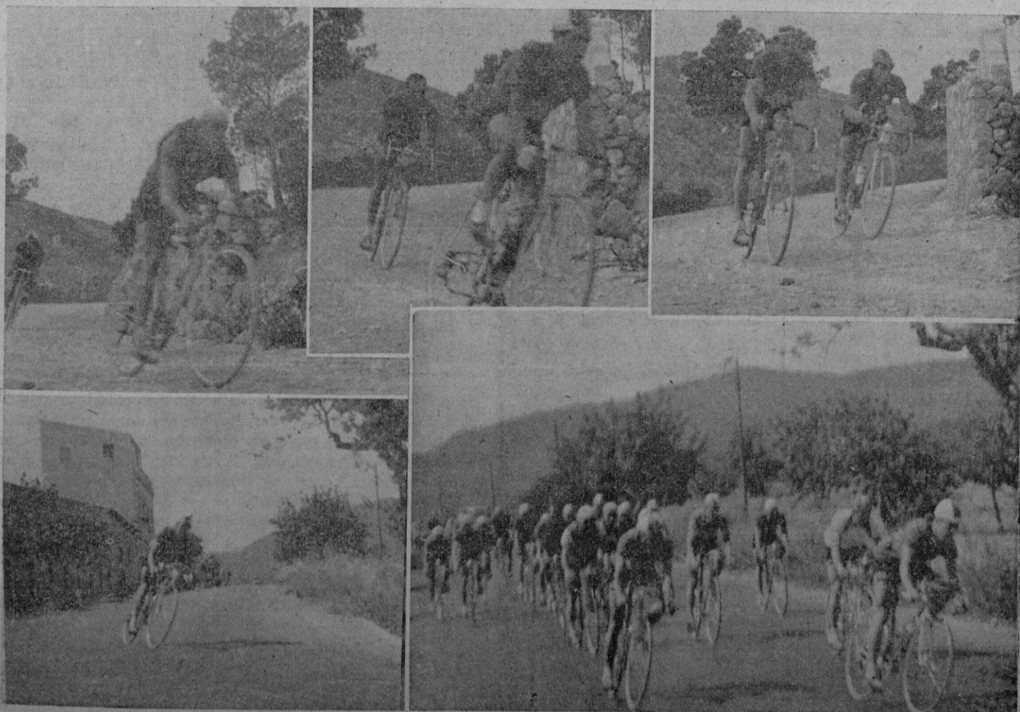
Nuestro diligente fotógrafo captó diferentes momentos de la primera etapa. Las tres primeras fotos muestran los seis primeros ruterros (por orden de izquierda a derecha) que escalan la subida del Puerto de Andraitx a Camp de Mar. La cuarta, recoge el primer corredor que pasa por Portals al regreso de Andraitx. En la quinta, el pelotón después de cubrir la áspera subida a Llachmayor