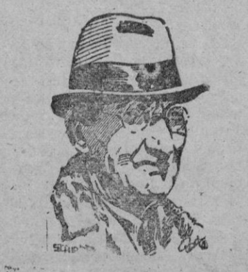
Schacht Teherán, 9. — El doctor Schacht llegó a Teherán en avión. Ha declarado que ha sido invita-

Posiblemente se enviará petróleo persa a Italia