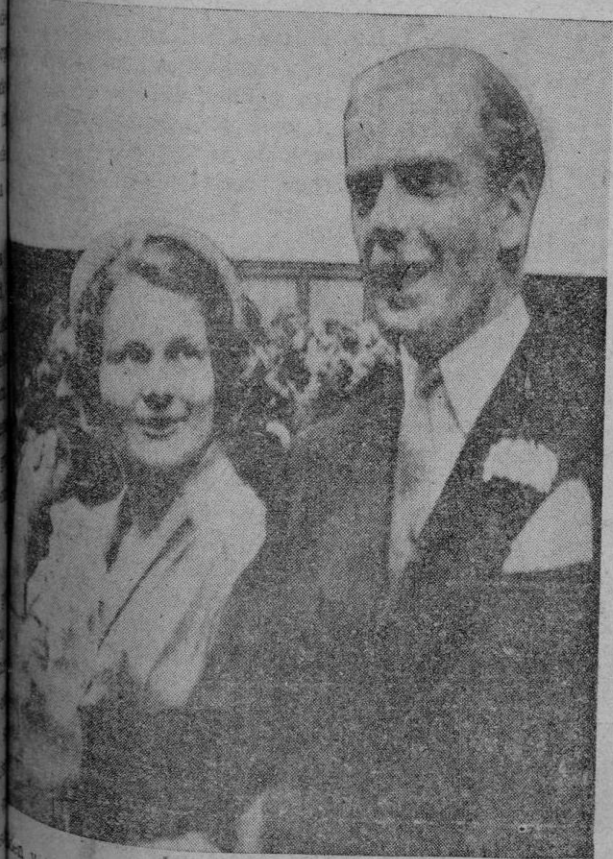
El novio y su esposa, aparecen sonrientes a la salida de la ceremonia de su enlace