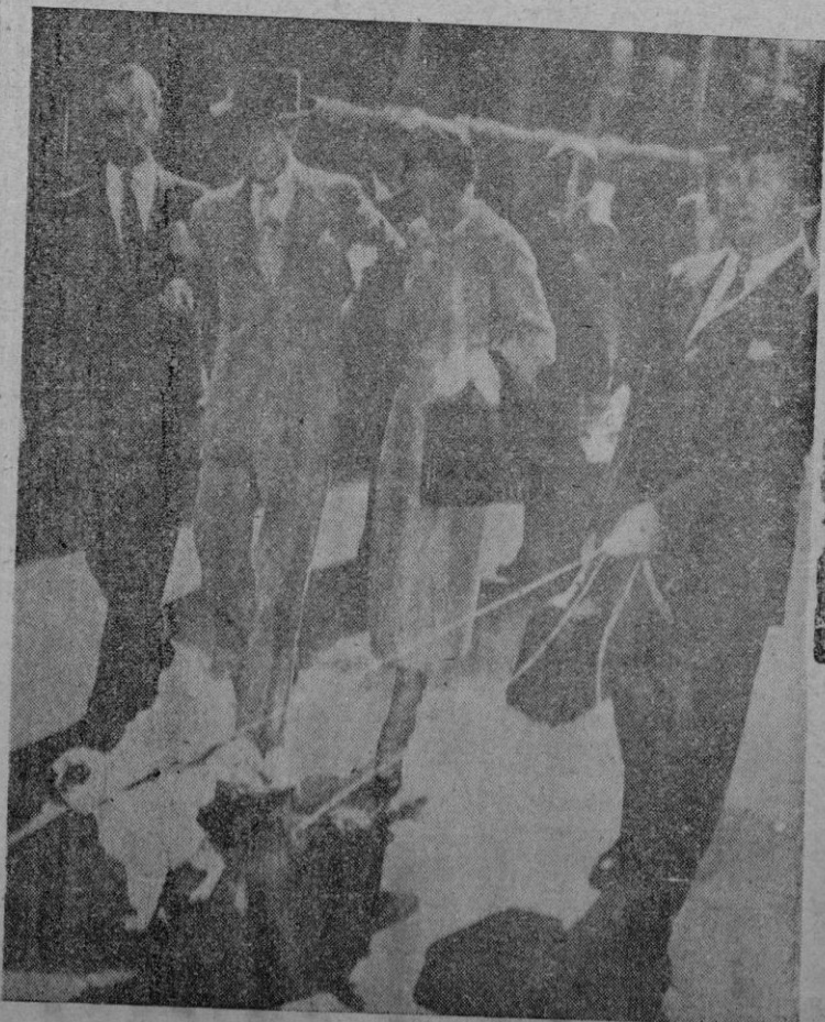
El Duque de Windsor, convaleciente de su enfermedad, llega a París del brazo de su esposa y uno de sus secretarios