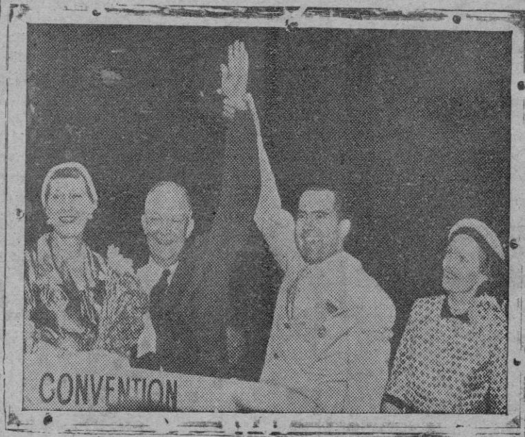
He aquí una foto del epílogo victorioso de la convención republicana de Chicago. Eisenhower y Nixon, elegidos candidatos a la Presidencia y Vicepresidencia, saludan con la mano levantada, acompañados de sus respectivas esposas. La reciente negativa de Eisenhower de acudir a la invitación del Presidente Truman ha sido calificada de poco afortunada y perjudicial para su próxima campaña electoral.