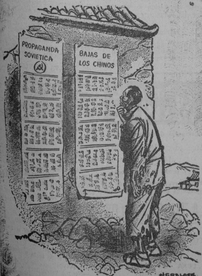
DEL DIARIO "THE WASHINGTON POST", DE WASHINGTON, D.C., E.U.A.