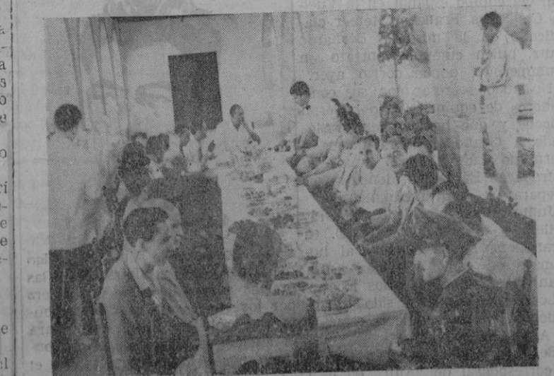
La Compañía Iberia reunió ayer en Son Bonet a un grupo de amigos y colaboradores, a quienes con motivo del 18 de Julio obsequió con un vino de honor.