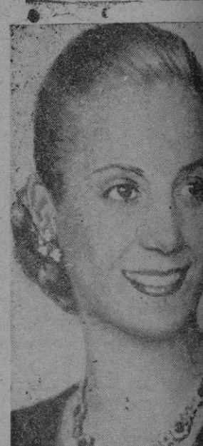
Eva Duarte de Perón

Buenos Aires, 11. -- La cía del Presidente Peron en su segundo día consecutivo en el pacho, ha producido profundos cambios en todas partes, donde se considera que es un indicio favorable de la gravedad de su enfermedad.