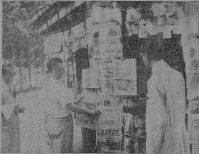
Diarios y revistas se ofrecen en polieromo conjunto a la voracidad del lector

—Si porque aquí se venden mucho más estos dos; y los turis-