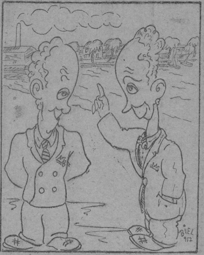
A BUEN ENTENEDOR... —¿A ver si sabes a que se refieren estos versos?: "Sutil aroma que embriaga..." —No digas más! al Portitxol.