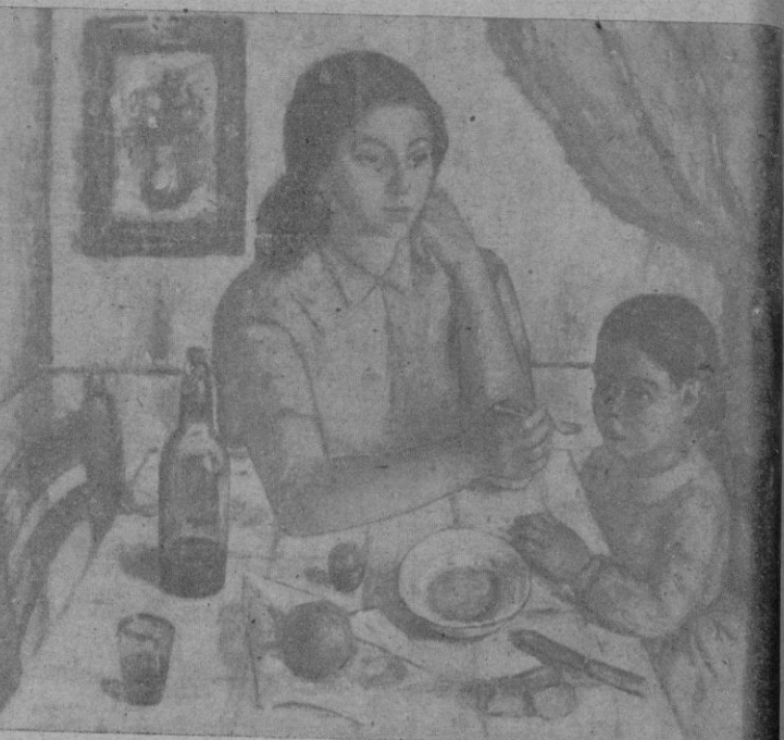
La Niña del Martinete, de Francisca Soriano

El III Certamen de Primavera por Museo Balear de Arte Moderno (Galerías Quint)