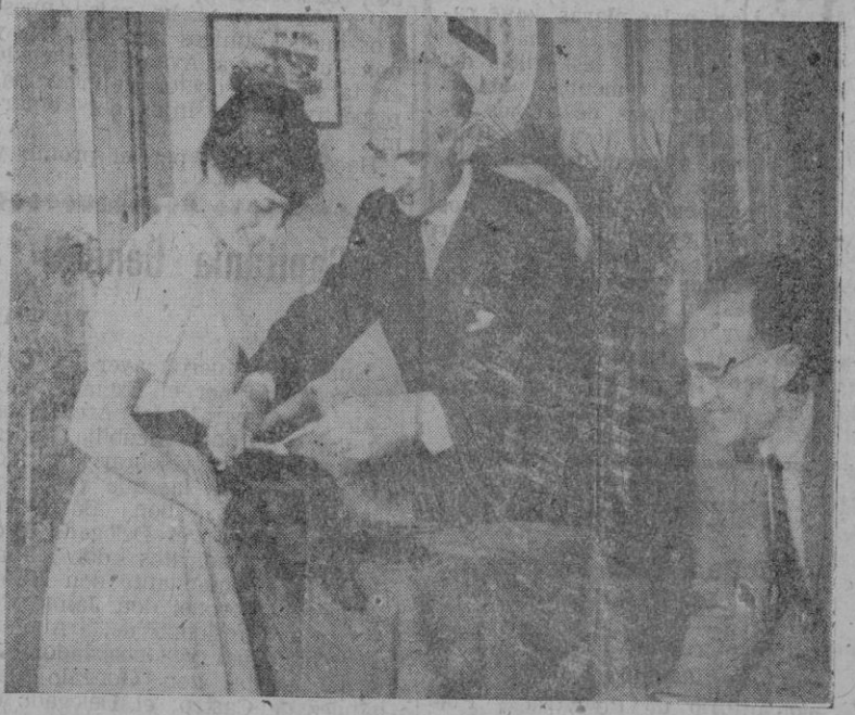
El Presidente de la Sociedad Protectora de Animales y Plantas, impone una medalla a la perrita "Rinski" cuyo vigilante celo evitó que el incendio de hace unas semanas, en la calle San Miguel, asumiera catastróficas proporciones