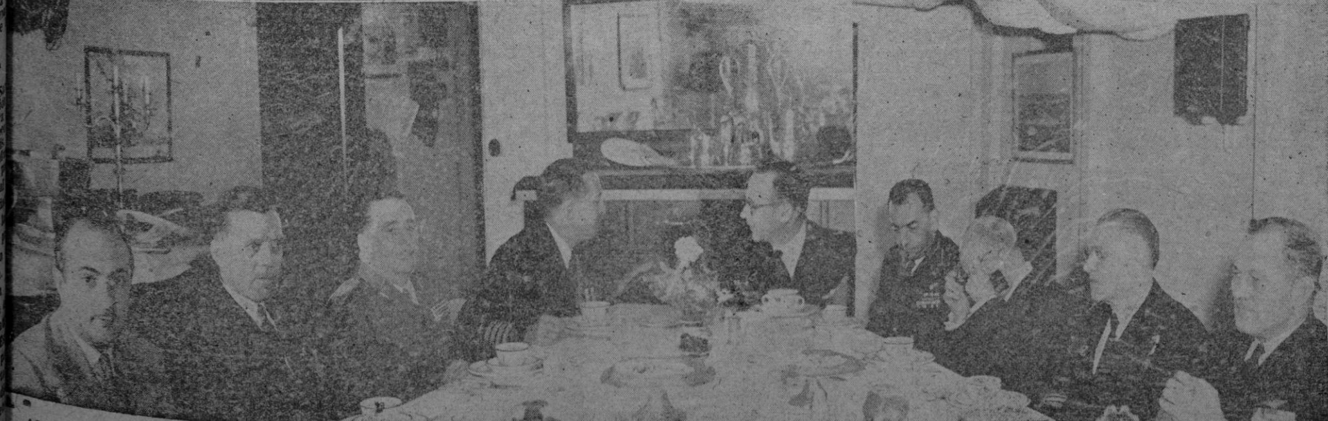
AUTORIDADES MILITARES Y CIVILES EN EL COMEDOR DEL PORTAVIONES "MIDWAY" DURANTE EL ALMUERZO QUE LES FUE OFRECIDO POR EL CONTRALMIRANTE DOYLE

Los aviones aliados destruyeron tanques comunistas a corta distancia de la línea de las Naciones Unidas, en el frente centro occidental.—Efe.