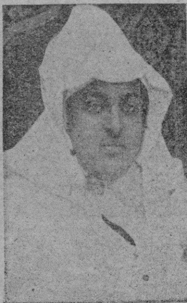
S. A. I. el Jalifa de Marruecos

—Las naciones occidentales, contesta el Jalifa—no tienen por qué inquietarse ante la cordialidad y estrechamiento de relaciones entre España y el mundo árabe. Son éstas unas relaciones plenamente naturales. España está unida con los árabes, y especialmente con