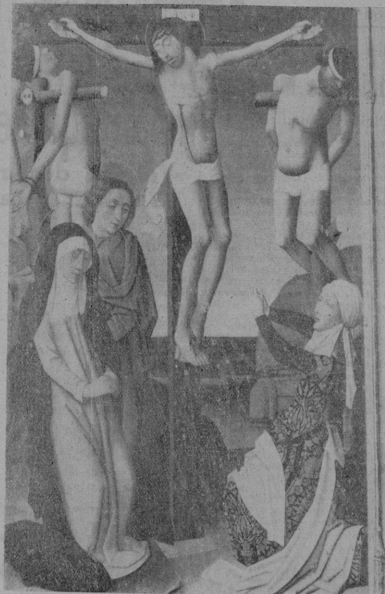
"Ecce Mater tua", tabla de la escuela flamenca de la colección March