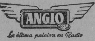
La última palabra en Radio