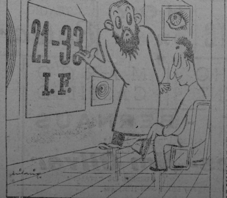
Claro que puede leerlo, bella señorita!