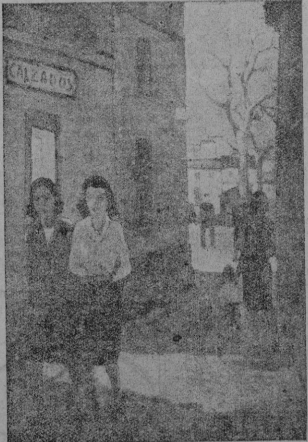
Una de las telas que figuran en la exposición de Cittadini en Galerías Costa

SOLUCION A LA CHARADA DE AYER "Locura" SOLUCION AL JEROGLIFICO PUBLICADO AYER "Las recetas escatiman"