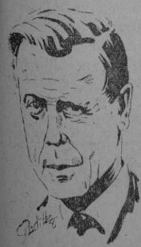
Duque de Windsor

28.—El Duque de Windsor ha salido hoy para Estados Unidos a bordo del "Queen Elizabeth".