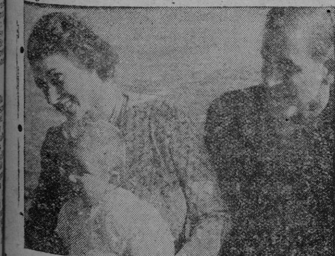
La reina Isabel y el Duque de Edimburgo con el Príncipe Carlos, que es actualmente el heredero de la corona británica