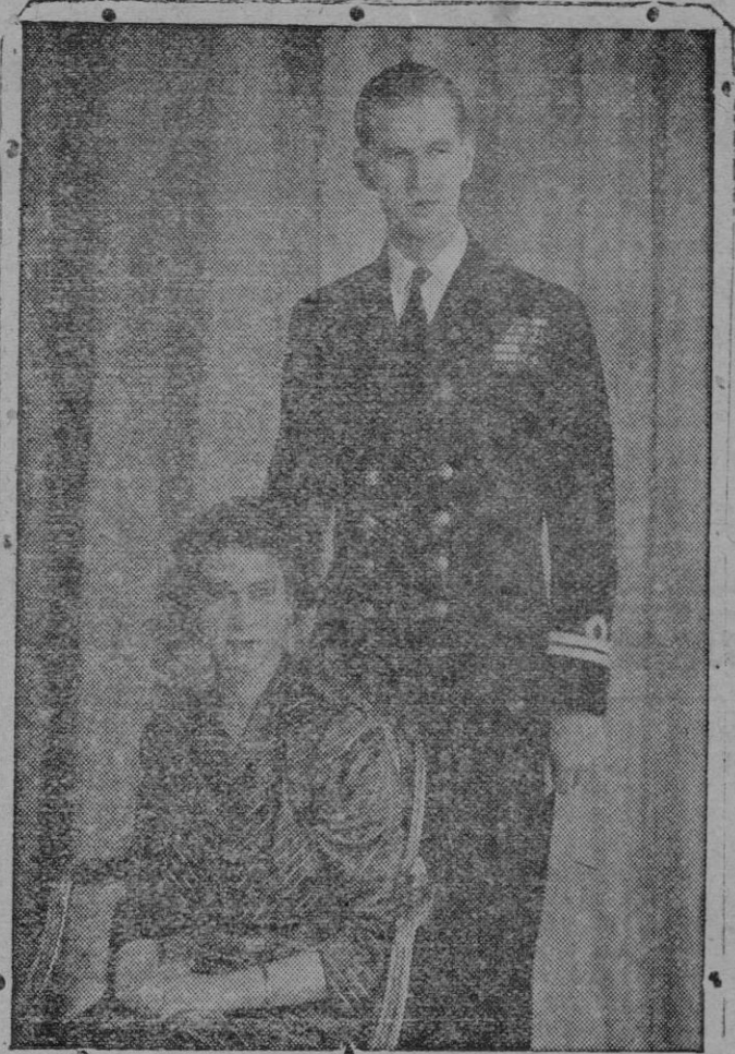
La nueva reina Isabel II de Inglaterra, fotografiada con su esposo el Duque de Edimburgo poco tiempo después de su enlace, cuando se instalaron en Londres

Ciudad del Cabo, 7.—El Gobierno surafricano ha proclamado Soberana de la Unión Africana del Sur a la Reina de Inglaterra Isabel II. La Cámara de Representantes aprobó la moción de leal adhesión al Trono y a la persona de la Reina.—Efe.