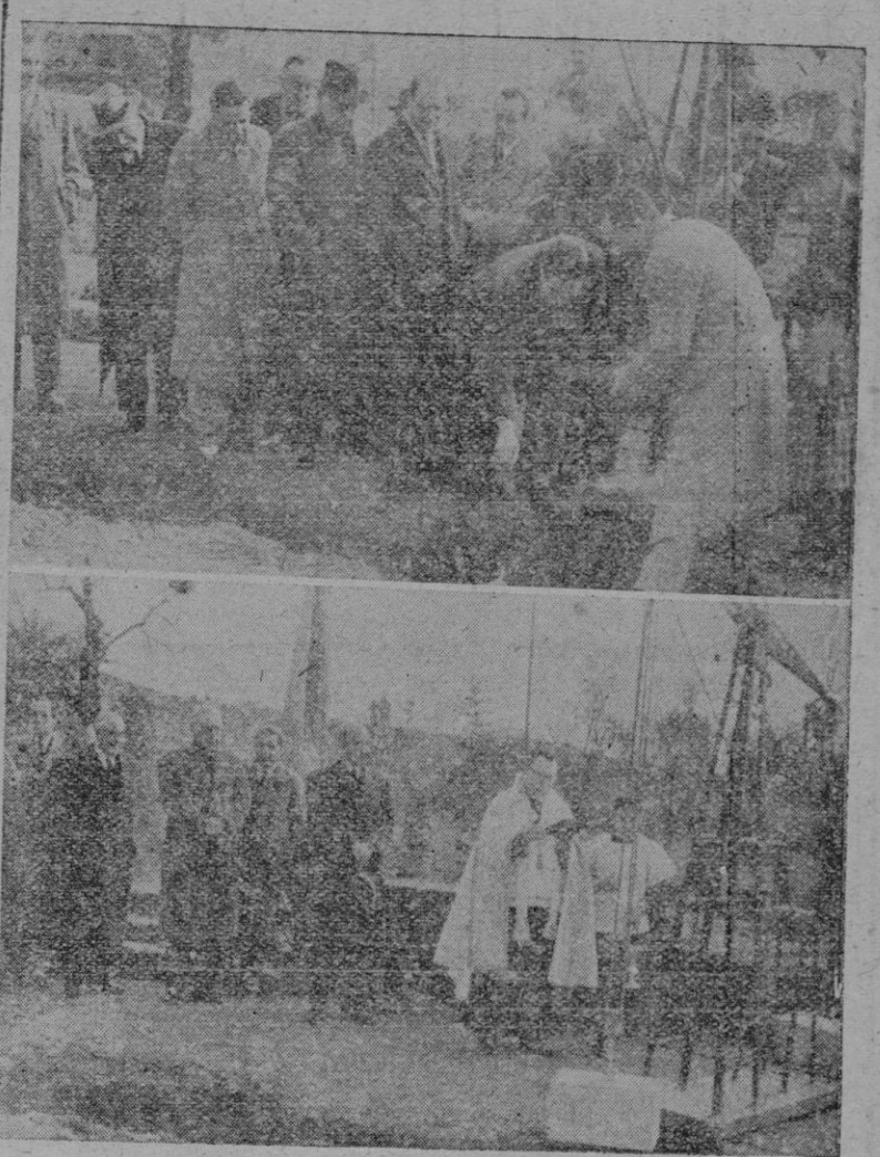
Arriba. Durante la colocación de la primera piedra del grupo de viviendas protegidas. — Abajo: El acto de la bendición.