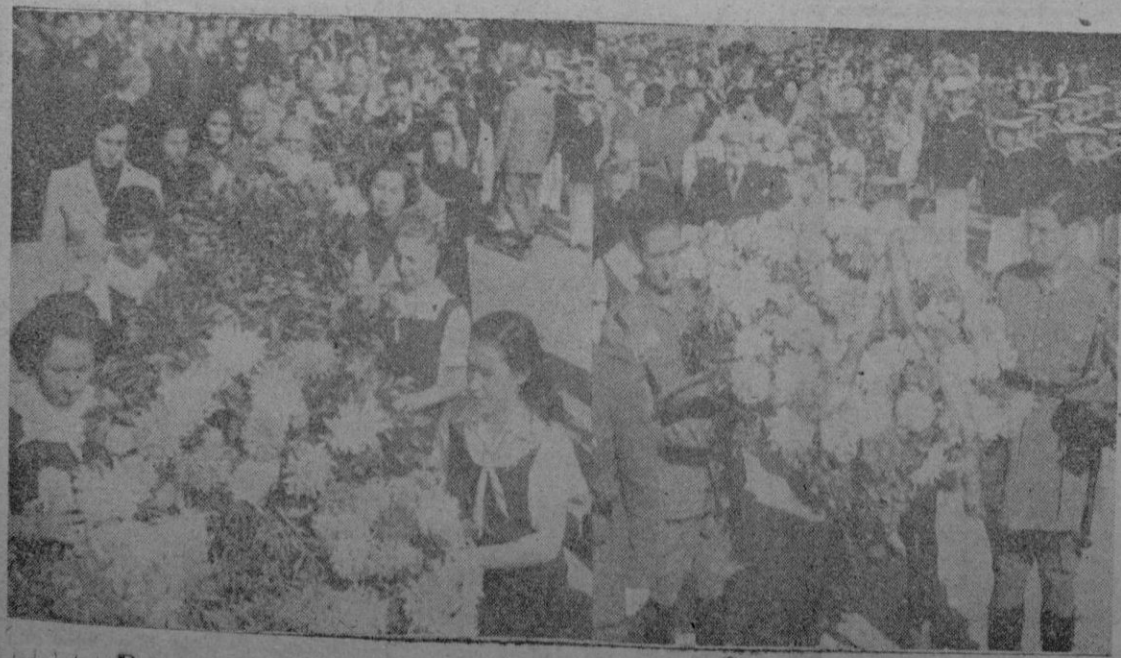
Dos momentos de la banda floral, depositada al pie de la Cruz de los Caidos