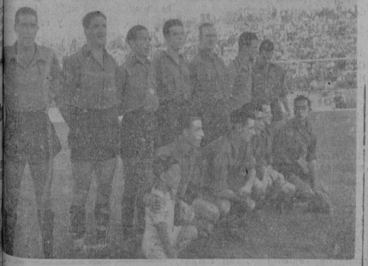
Mallorca, que, tras su triunfo sobre el Alicante, el pasado domingo, se ha colocado en cabeza de la clasificación de su grupo

Tokio 17.—"Japón debe rearmarse lo antes posible", ha afirmado el Primer Ministro Yoshira, decano del partido demócrata. Añadió que la mayoría de la población aprueba el rearme. Yoshira es partidario de pedir a los Estados Unidos que apliquen al Japón el plan de ayuda al exterior.—Efe.