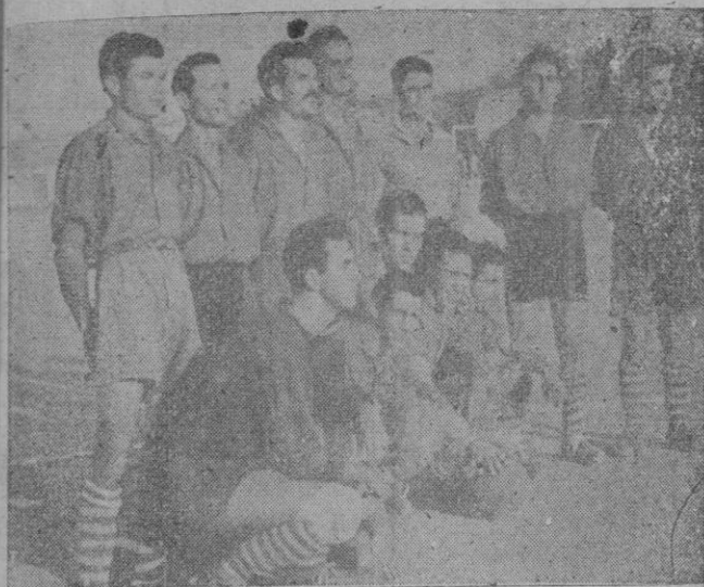
Equipo del Colerense que tras vencer al Soledad por 3-1, se ha llamado campeón de Liga Mallorca grupo Palma, culminando con ello su brillante temporada.