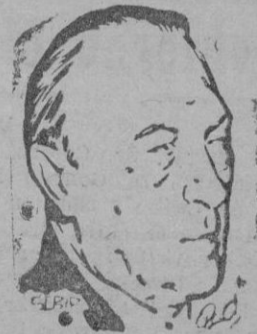
El canciller Adenauer