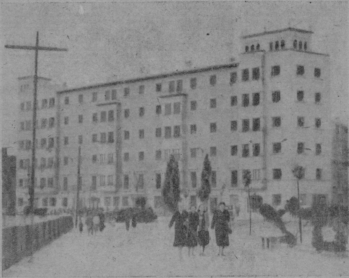
Vista general del soberbio edificio del Gran Hotel Jaime I