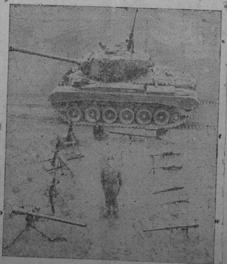
Fotografía tomada en el Fort Penning de Georgia, EE. UU., donde pueden apreciarse las diversas armas utilizadas por la infantería norteamericana, y cuyo manejo se enseña a los oficiales de los países del Pacto del Atlántico que acuden a los Estados Unidos en período de instrucción especial