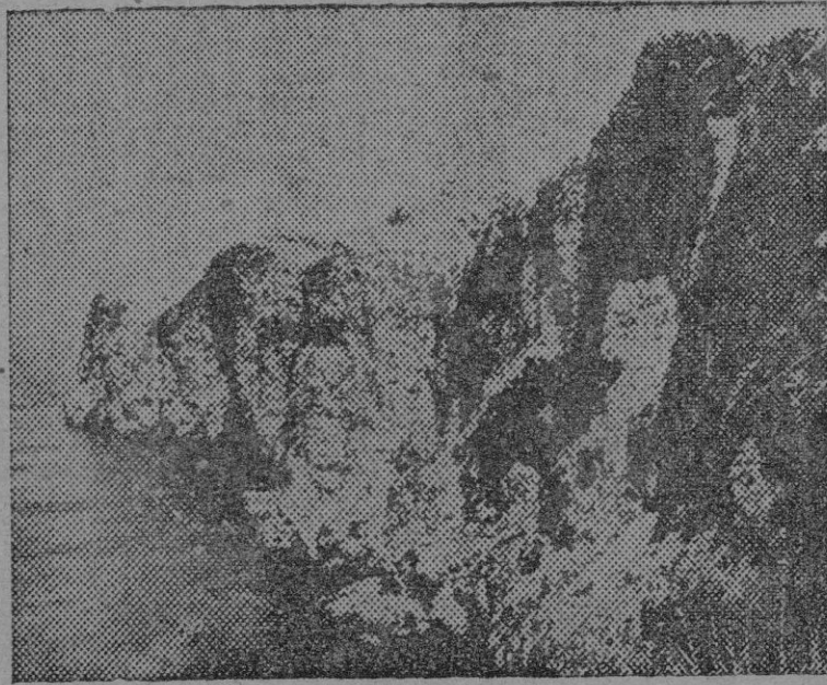
He aquí uno de los bellos rincones de nuestra costa brava que se admiran desde la nueva carretera que desde el Hotel Formentor conduce al faro del mismo nombre

(Lea en la pág. 4.º un interesante reportaje sobre la modernización de las carreteras de la isla y las nuevas rutas de turismo)