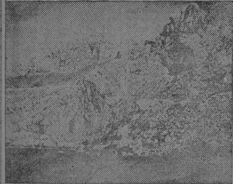
Vista de la zona de la carretera de Pollensa al Faro de Formentor, donde se ha tenido que construir un túnel, construcción en que tuvieron que vencerse no pocas dificultades

(Termina en la primera columna de la página siguiente)