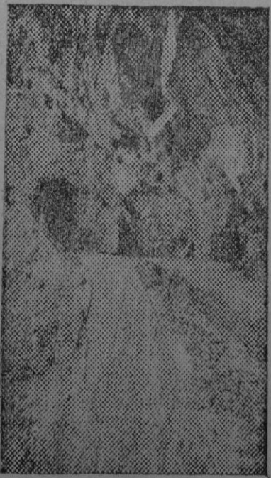
La entrada del túnel en la carretera al Faro de Formentor. En la fotografía puede observarse la importancia de la obra y a la izquierda de la entrada se percibe la escalera que hubo que construir en la roca para llevar a cabo los trabajos preliminares

Actualmente se está llevando a cabo la desviación de la travesía de la ciudad de Inca. El nuevo trazado arranca del kilómetro 28 de la carretera y se desarrolla al Sur y al Este de la ciudad. El cruce con el ferrocarril de Palma a Manacor se hará por medio de un paso inferior, desviando provisionalmente la línea del citado ferrocarril. El nuevo trazado de la carretera enlazará con la actual