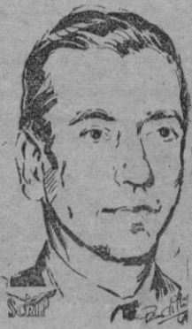
H. J. Paz, ministro argentino de Asuntos Exteriores

Washington, 4. — Méjico se ha opuesto, en una Subcomisión, de la Conferencia de Ministros de Asuntos Exteriores, de la Organización de Estados Americanos, a una moción estadounidense según la cual las Naciones iberoamericanas han de destinar tropas a la defensa del Hemisferio occidental o encargarse de misiones de carácter militar en cumplimiento de las resoluciones de la ONU.