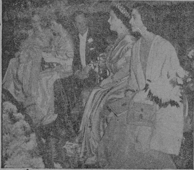
La familia real inglesa en un festival benéfico

"Lo que cuesta ser rey". Este podía haber sido el título del editorial que publica el "Times" explicando como las condiciones de vida han afectado también a la Real Casa. El diario dice así: "La elevación del coste de vida, que todas las clases sociales de la Gran Bretaña padecen, ha afectado seriamente la situación del más elevado personaje del país. Su majestad el rey tiene un ingreso fijo; pero sus gastos fluctúan con los precios igual que los de sus súbditos. Al subir al trono Eduardo VIII, un Comité de la Cámara de los Comunes fijó el ingreso necesario de un soberano casado en 410.000 libras, de las cuales 110.000 se destinaban a gastos privados, y el resto a satisfacer salarios y desembolsos de la Real Casa. Debido al estado de soltería del rey Eduardo VIII, se realizó una adecuada reducción de sus ingresos; pero se aplicó el cálculo original cuando los actuales soberanos ocuparon el trono. Como no tenían ningún hijo, los ingresos del Duque de Cornwall, dedicados a dote del heredero fueron y se encuentran en la actualidad a disposición de los soberanos. Después de estipular las rentas de la princesa Isabel y del duque de Gloucester, el exceso de aquel Ducado, estimado en 90.000 libras por año, fue dedicado a satisfacer necesidades