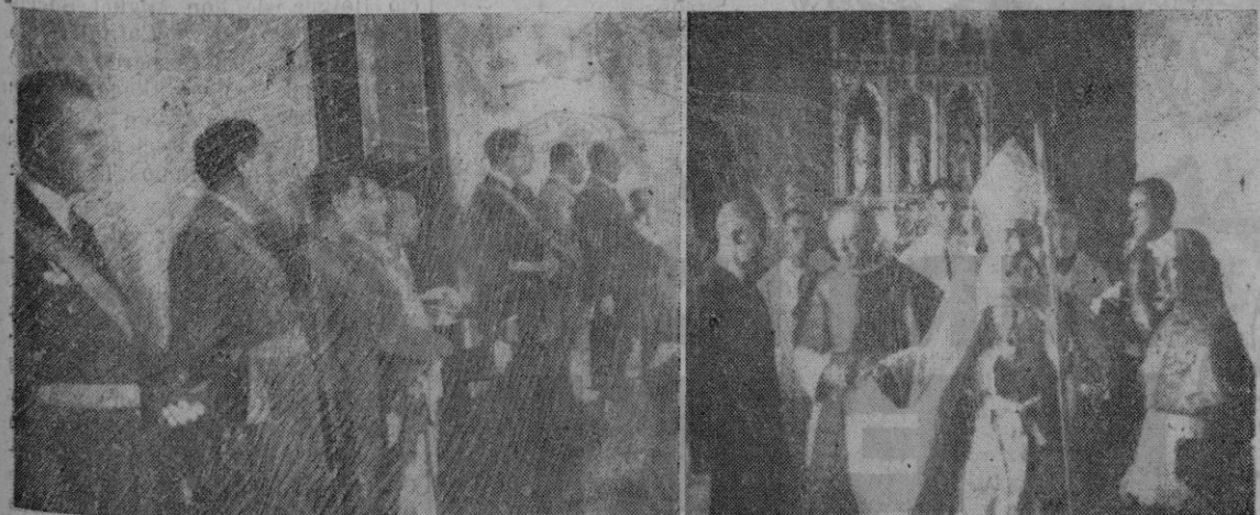
La presidencia de la recepción en Capitanía General. El Excmo. Sr. Obispo en la bendición de la casa del sacerdote.