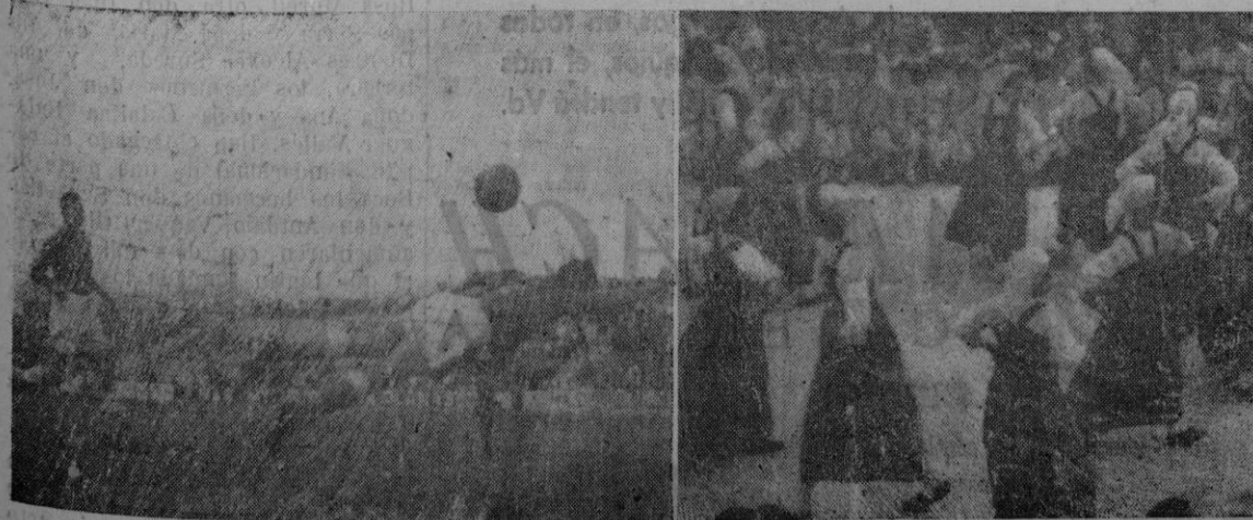
El primer gol logrado por el Mallorca. Un aspecto de la fiesta en el Puig dels Bous.