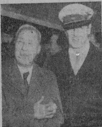
El Presidente Rhee con Mac Arthur

Mac Arthur ha ganado ya la guerra de Corea contra todas las opiniones y todas las oposiciones. "No habrá nuevo Dunkerque" dijo en el momento más crítico. Pocas semanas después asestaba su martirio en Inchon. Mac Arthur ha acertado en Oriente, una vez más, a sus 70 años vigorosos. A su experiencia y a su capacidad militar deben atribuirse la victoria norteamericana de Corea.