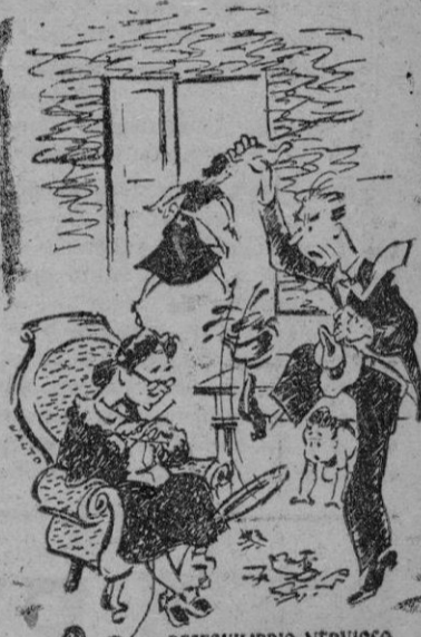
DESEQUILIBRIO NERVIOSO Cuando el sistema nervioso está débil o agotado, estalla en violencias al menor contratiempo.

Palma de Mallorca, a 12 de Agosto de 1950. — El Gobernador Civil.