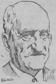
Conde de Romanones

San Sebastián, 12. — A primera hora de la tarde, el estado de salud del Conde de Romanones sigue siendo muy delicado. No ha sido facilitado ningún parte facultativo por los doctores que le asisten. — Cifra.