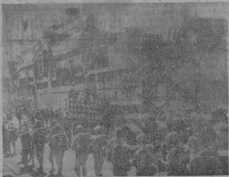
Tropas norteamericanas embarcando en un puerto del Pacífico para incorporarse a las fuerzas de Mac Arthur