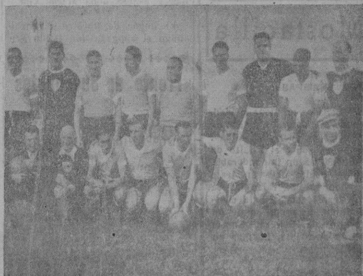
Río de Janeiro.—Esta es la selección nacional del Uruguay que, con su brillante victoria sobre el Brasil, se ha proclamado Campeón del Mundo de Fútbol