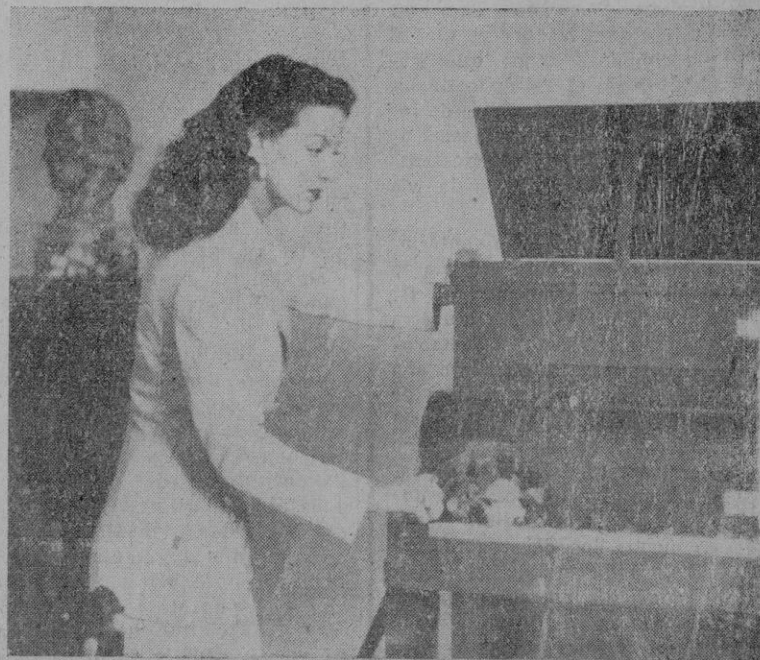
María Félix, la bella artista, estuvo días pasados en la Cartuja de Valldemosa, y delicadamente, depositó un ramo de flores sobre el teclado del piano que recogió las inquietudes del glorioso y apastado genio de los nocturnos.