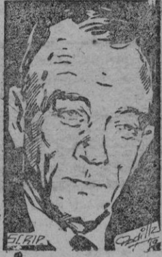
Embajador Allan Kirk

Washington, 18. El texto de la nota norteamericana, enviada por el embajador de los Estados Unidos en Moscú, Allan Kirk, en contestación a la nota soviética sobre el incidente aéreo ocurrido el día 8 del actual sobre Letonia, es el siguiente: