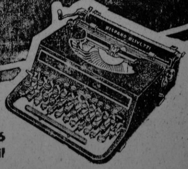
M. 5. 46 Tipo Semiportátil

Fábrica y Oficinas: Avda. José Antonio, 860-872 BARCELONA