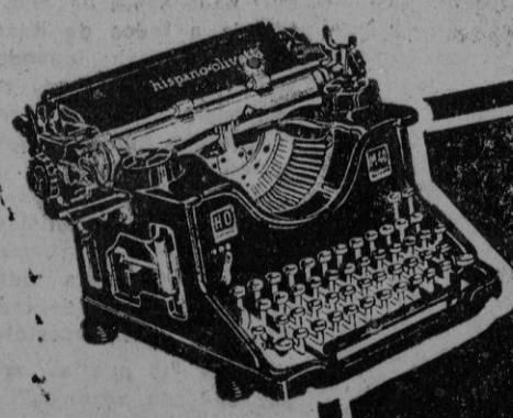
M. 40 Tipo Oficina

Fábrica y Oficinas: Avda. José Antonio, 860-872 BARCELONA