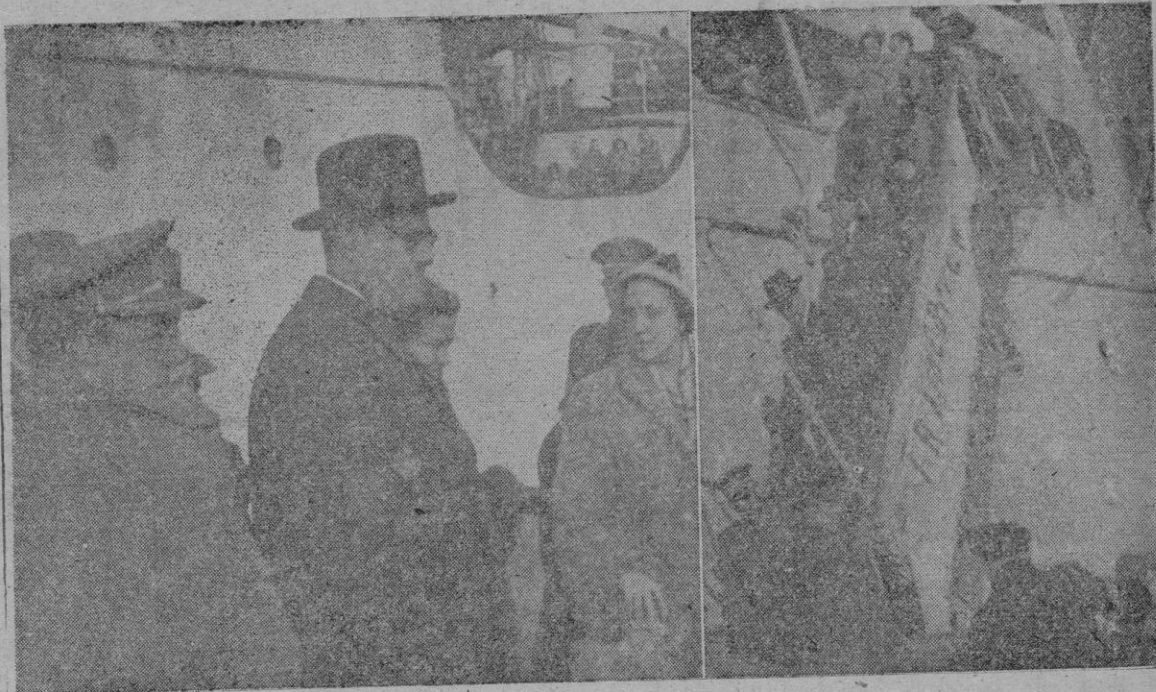
El Excmo. Sr. Ministro de la Gobernación don Blas Pérez González y su distinguida señora momentos después de desembarcar. -- El distinguido viajero y las personalidades que acudieron a saludarle desde el muelle de la motonave "Ciudad de Sevilla".