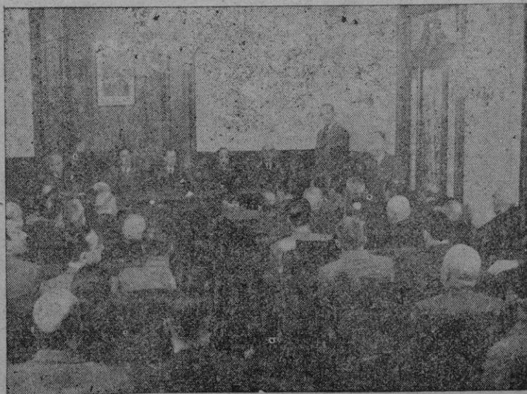
El acto de entrega de premios a los ganadores del Concurso entre Empresas Agrícolas, organizado por la Obra Social Agrícola de la Caja de Pensiones para la Vejez y de Ahorros celebrado ayer