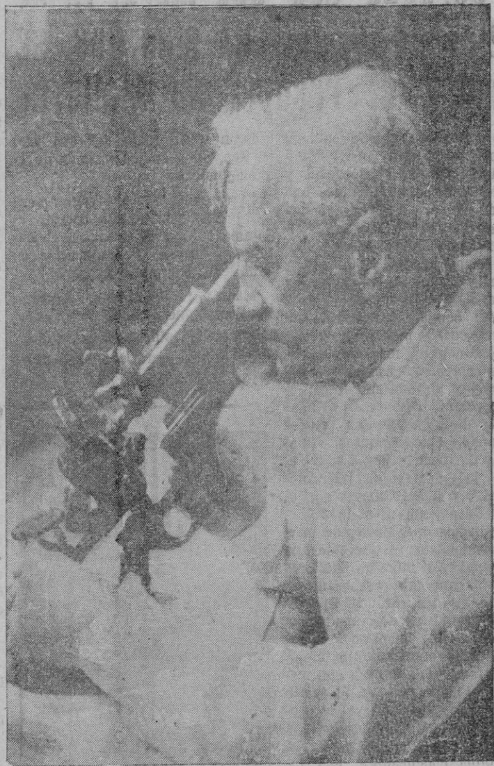
El Dr. Fleming, descubridor de la penicilina

«La penicilina es el resultado de cinco casualidades», ha declarado