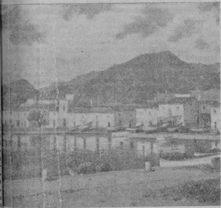
"Puerto de Pollensa". — Oleo de Pascual Roch

CHICAGO. — William Fritz, repartidor de leche, ha sido detenido por estar acusado de agudrear las puertas de los domicilios en la que hervía leche, con el fin de curiosear lo que ocurría en el interior de los hogares. Fritz ha sido sorprendido cuando hacía su veinte agujero.