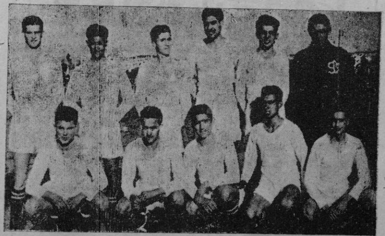
El equipo del Sueca que fué ampliamente batido por el Manacor

No era temida la visita del Sueca, recheando las oportunidades que caían y, efectivamente, su inocuidad se presentaron y dando la impresión manifiesta. Se trata de un conjunto de jóvenes que se dedican al fútbol. No nos cabe la menor duda de que si se hubieran lanzado todo entusiasmo y corrección por el campo con un poco más de coraje —la-