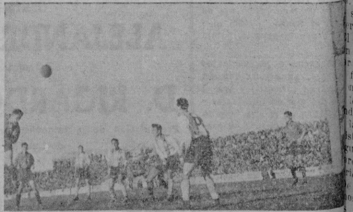
La jugada que valió el primer tanto del Mallorca

Muy valiosa es la victoria que el domingo se apuntó el Mallorca debido a que fué conseguida luchando contra varias y distintas así como poderosas oposiciones. A los buenos destos de los mallorquinistas se oponían como es natural, los once jugadores alcoyanistas, pero también se oponía, además de otros síbidos factores, la voluntad del árbitro, ya que el catalán Jané, demostró bien a las claras que sus deseos eran de que los visitantes se llevaran algún punto y bien que les ayudó para que lo consiguieran. Si no pudo lograrlo ver, fué porque el Mallorca hizo lo suficiente para que su triunfo fuese alcanzado por un rotundo tanto y por una diferencia por lo menos de cuatro tantos, en lugar del resultado de dos a uno que se registró, bien en contra de los deseos del colegiado catalán.