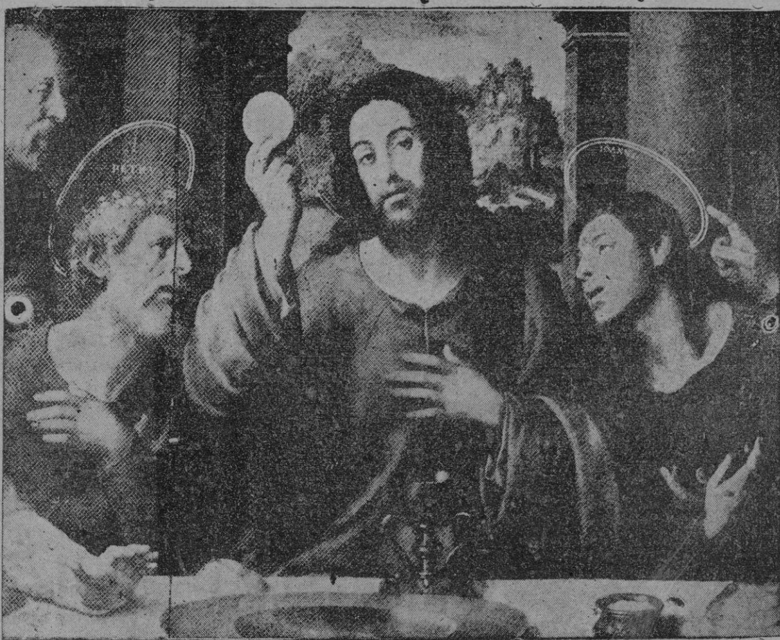
UN FRAGMENTO DE "LA CENA" DE JUAN DE JUANES QUE SE CONSERVA EN EL MUSEO DEL PRADO

En la pasada me- primer contingente de a los empleados que aban- el mayor abastecimiento reclamación de au- al día. - Efe. A causa de la huel- onarios públicos, están los servicios de Co- mayor conve- lo regular comunicaciones telefónicas Ninj. Mar- están limitadas a los "vida o muerte". y los autobuses fun- que acaban ente esca- servicios de gas, electri- que, aunque otros sufren presencias de la huelga. en. profesores de liceos también la huelga. - Efe.