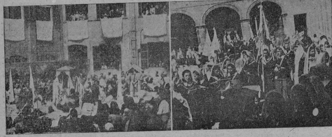
La imagen de la Virgen en uno de los patios del Hospital y en el de la Misericordia.