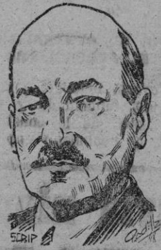
MANIFESTACIONES DEL PRIMER MINISTRO BRITANICO

Londres.— El Jefe del Gobierno británico, Clement Attlee ha manifestado en una reunión celebrada en Norwich con motivo del primero de Mayo que solo puede verse garantizada la libertad en una sociedad organizada en que «las fuerzas económicas ciegas» sean controladas en interés de todos. Las cuatro libertades en que cree el laborismo británico— dijo— son: libertad de palabra y de conciencia; libertad de elección de los gobiernos; libertad del individuo frente a la opresión del fuerte y libertad del individuo frente a la tiranía del poderío económico detentado por los menos. «Lo que estamos edificando aquí —añadió— es la seguridad colectiva, lo mismo que en el mundo tratamos de establecer la paz por medio de la seguridad colectiva contra cualquier que pudiera manifestarse agresor».