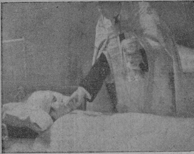
Momento de la comunión de una de las enfermas