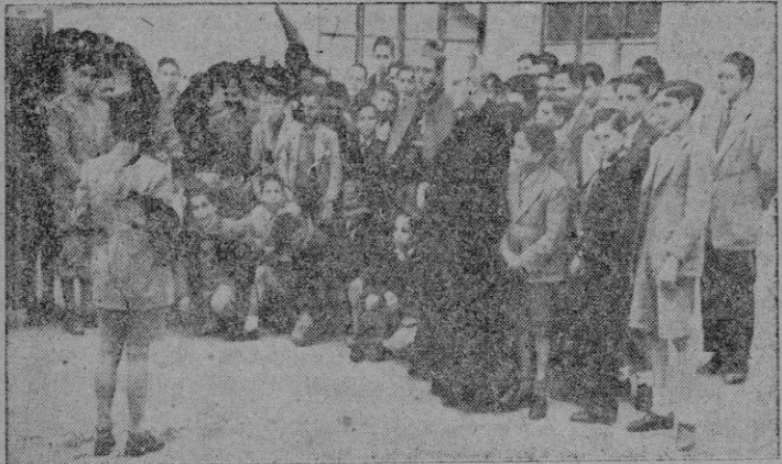
Uno de los alumnos ofrendando el acto a S. E. Rdma.