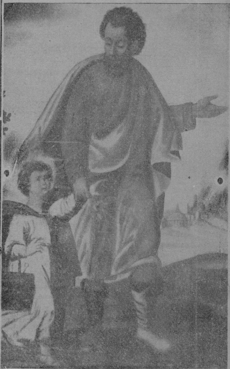
El Patriarca San José, cuya festividad celebra hoy la Iglesia (Fragmento de un cuadro atribuido a Gaspar Homs, Colección Marqués de Campofranco)